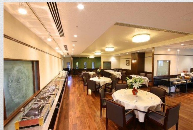
喜多館2階中国レストラン 『来来飯店』