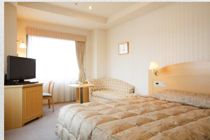
例:ダブルベッドシングル 約20㎡/160X200ベッドサイズ