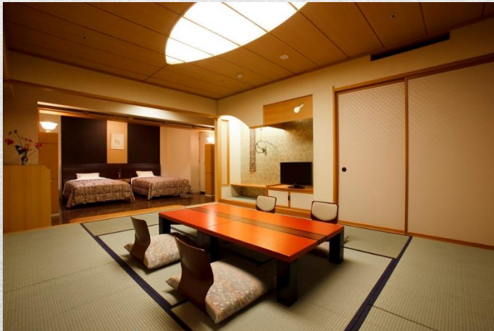
例:和洋室 約63㎡/110X200ベッドサイズ <バス・トイレはセパレートタイプ>