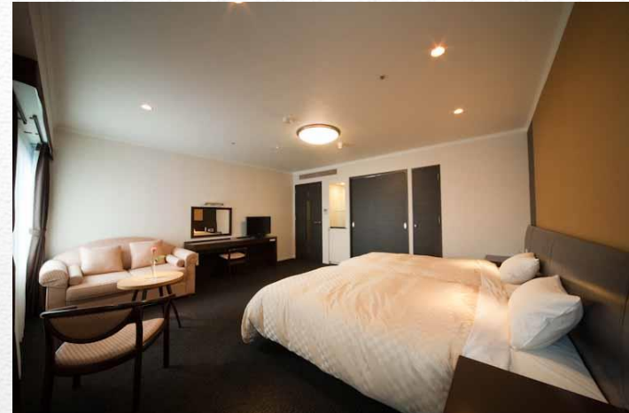
例:ジュニアスイート 約40㎡ <シャワーブース付タイプとパウダーコーナー付タイプあり>