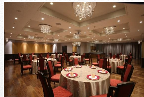
バンケットホール:ドンキホーテ 宴会の余韻は2次会場にていかが？(事前相談必要)