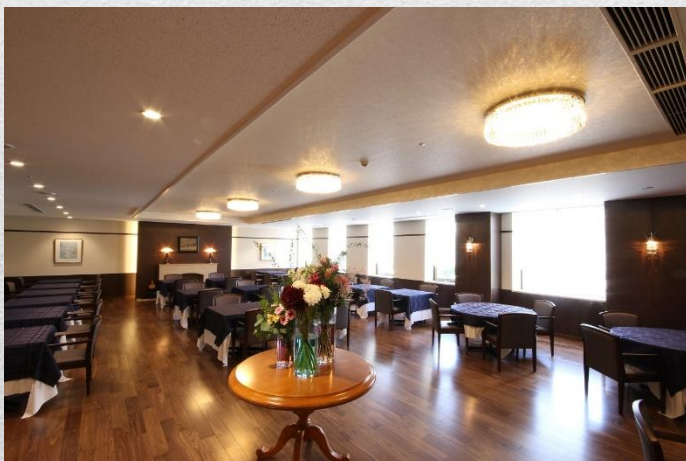
喜多館2階仏蘭西レストラン 『ボンジュール』

館内のお食事処／レストランも明るく開放的な空間を醸し出しております。旅の会話も自然と弾みます。