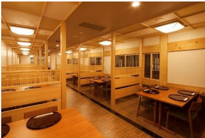
東館2階和食処『匠茶屋』