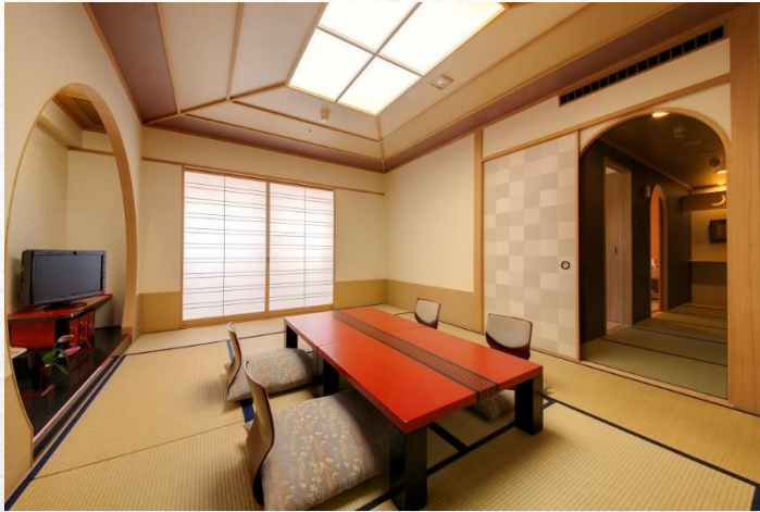
例:特別和室 10畳+6畳の2間プラスツインベッド付 <バスタブは檜使用・トイレはセパレートタイプ>